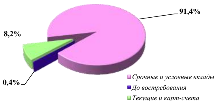
Диаграмма 2. Структура розничных депозитов по основным категориям (в %)

Совокупный депозитный портфель банков-участников состоит на 91,4%, или Т5,2 трлн. из срочных и условных вкладов, увеличившиеся за квартал на Т1,4 трлн., или на 35,2%, остатков на текущих и карт-счетах с долей 8,2% (Т469 млрд.), объем которых сократился почти на Т9,7 млрд., или на 2%, и вкладов до востребования с долей 0,4% (Т21,6 млрд.), увеличившиеся за период на Т11,7 млрд., или в 2,2 раза.